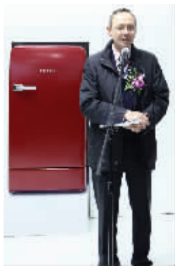
博世:红魔复古单门冰箱惊艳全场

3月15日,2011中国家电博览会终于在上海新国际博览中心开幕。此次展会面积接近3万平米,比上届增加了50%。