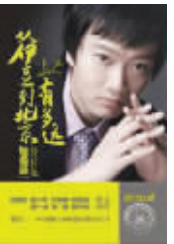
《从伊豆到北京有多远》 作者:加藤嘉一 江苏文艺出版社 定价:25.00元

一部具有励志色彩的传记作品。“营销铁娘子”严旭结合自己在12年的游泳生涯和23年啤酒行业的打拼生涯中经历的事情,阐释了对于成功、人生、幸福、挫折等的思考,极具借鉴意义。