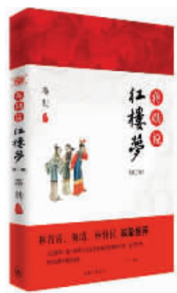
《蒋勋说红楼梦》作者:蒋勋 上海三联书店 定价:35.00元