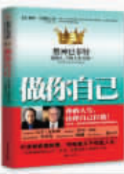
《做自己》 作者:彼得·巴菲特 出版社:新世纪出版社 定价:28.00元

他1984年出生于日本美丽的伊豆,他放弃东京名牌大学的录取通知书,一句中文不懂的他到北京求学,他做过人大附属中学日语教师,是一个高明的谈判者,也是曝光率最高的在华日本人。