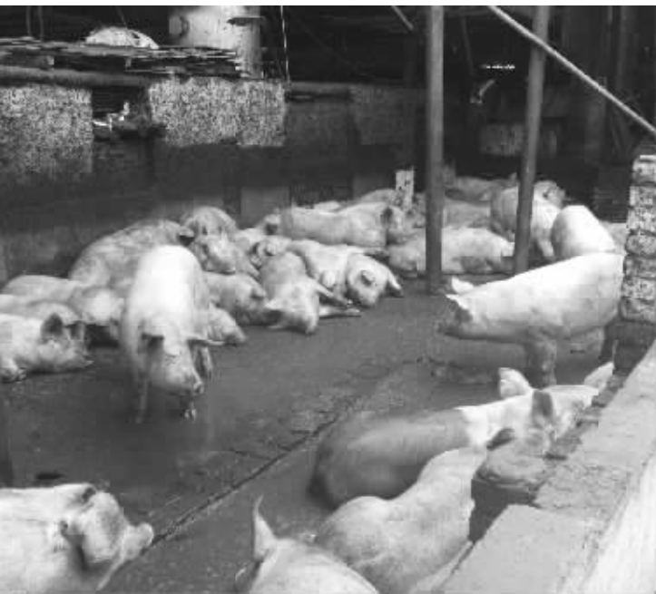
建邺兴旺屠宰场里病恹恹的“健美猪”

可是屠宰场里一位姓白的工作人员却说:“我们也知道从河南来的生猪喂过瘦肉精,但工厂化养殖的生猪很多都是这样养出来的。”据他介绍,兴旺屠宰场里有80%的生猪来自河南,小刀手从屠宰场又把猪卖到南京各大农贸市场,在南京80%的农贸市场里,都能看到兴旺屠宰场卖出的猪肉。他还告诉记者,只要停喂瘦肉精,让猪通过排尿代谢,20天后再出栏,这些“健美猪”的尿液就不容易再检出问题。他满不在乎地说,“河南的猪也不是今年第一次发现有瘦肉精,往年也有……”