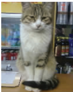
招财猫 看过我的人都说我像招财猫，你看像吗？ (作者孙荣获30元话费)