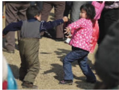
好女不和男斗 好女不和男斗，你别逼我出手。哈哈，图片也会骗人哦，其实我们是在跳舞。摄于梅花山 (作者朱卫东获30元话费)