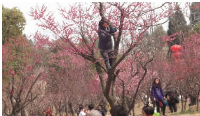
快下来 爱美可以理解，上树却是不雅。摄于梅花山 (作者李继民获30元话费)