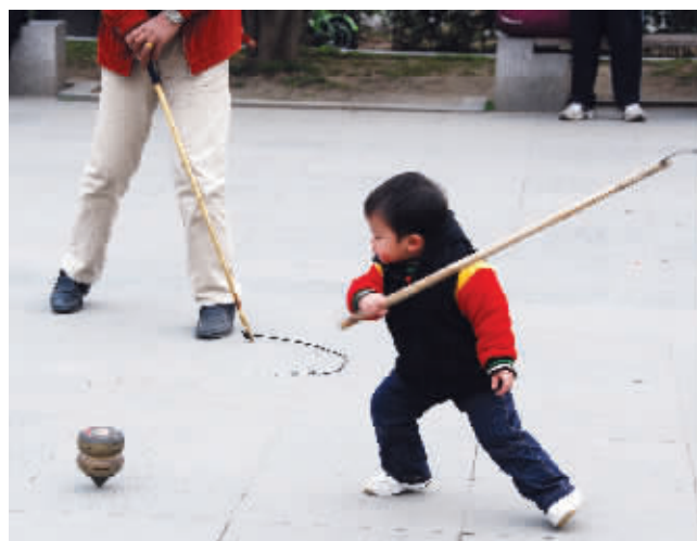
我就不信，还玩不转你了。看我的，前弓后绷，是不是有模有样啊。摄于郑和公园 (作者陆如硕获30元话费)