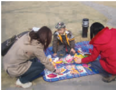
小老板 年方7岁，摊龄2年；一身行头，真像老板。或卖或换，只因勤俭；相聊甚欢，送你一件。3月13日摄于石头城 (作者烦烦获30元话费)