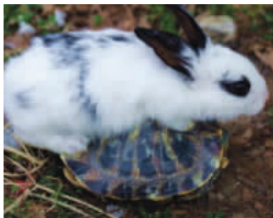
龟兔赛跑 兔子一直想正名，终于等来了机会。 摄于下关多伦路 (作者季青获30元话费)