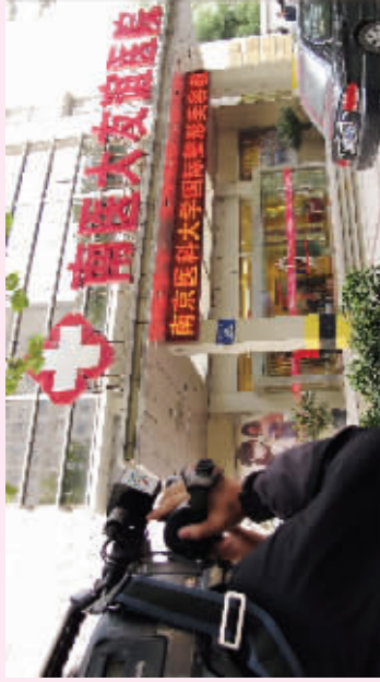
▲电视台抵南京友道整形外科医院采访

纯韩微整形，不仅是医学领域的核心力量，更是保障美丽安全的基石。南京友道整形外科医院（南京医科大学国际整形美容教学与研究分中心）在单科教学与研究上，是我国唯一专攻开展纯韩微整形、临床教学与科学研究国际整形美容机构。同时，作为三级整形外科医院，以纯韩微整形为基础，主攻下颌角、颧骨整形、巨乳缩小、腹壁整形等国家规定的4级（最高难度）整形美容项目，并坚持开展着至今被世界医学界认为最难的整形外科手术——颌面正颌而名扬海外。