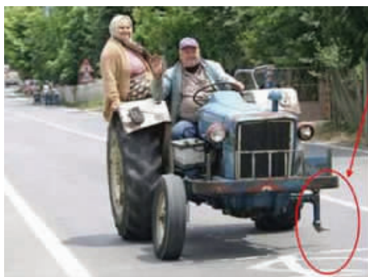
体重有的时候会很有用