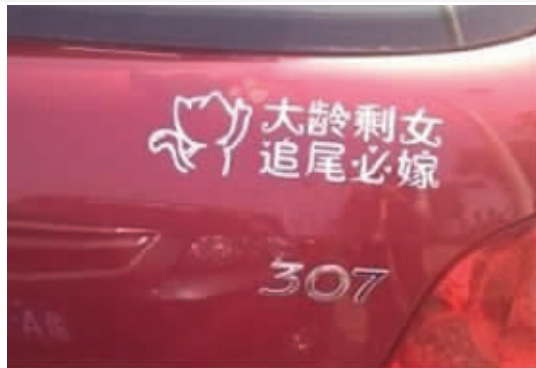
“随手撞”解救大龄女青年