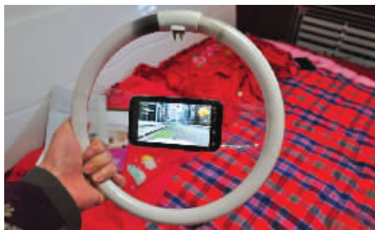
破灯管是玩极品飞车之利器