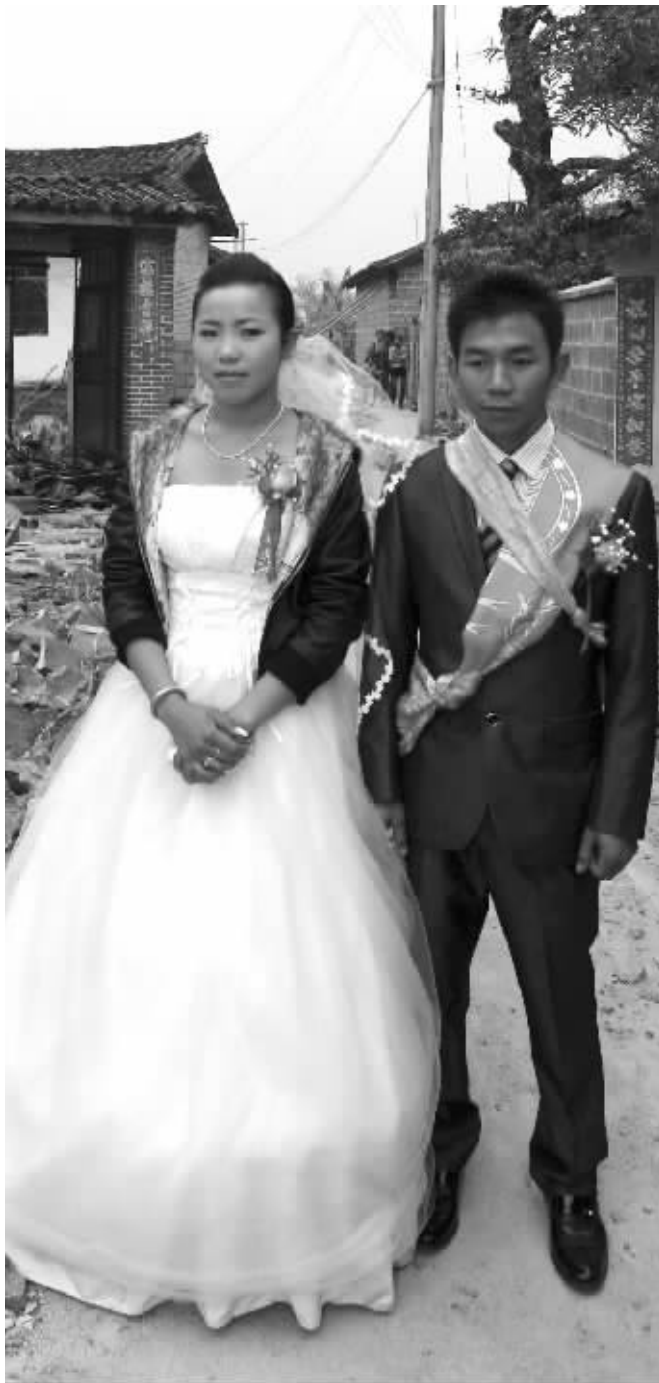
这对新人在废墟上举行了一场别样的婚礼

采访中,恰好遇到几名县水利局工作人员,他们正向裂缝中浇灌石灰浆。随后我们要把裂缝挖开,进而确定裂缝的深度。”据介绍,裂缝深度确定后,就能为下一步制定修复方案提供依据。而对两岸灌区裂缝的检测工作也将很快展开。综合