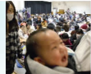
3月12日,福岛县一个避难所

看到日本,想起汶川。 尽管相隔大海,但我们依然切身感受到了来自对岸的无尽痛楚。 那是生与死的痛苦别离,那是家园被毁的颠沛流离,那是山河破碎的胆战心惊……这些,对我们来说并不陌生。 一幕幕伤心的画面,一声声焦虑的呼喊,一双双无助的眼睛,都深深地印刻在我们心里,提醒着我们生命的脆弱,告诫着我们去尊重生命,敬畏生命。