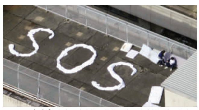
希望 在日本宫城县气仙沼市,等待救援的民众在屋顶拼出“SOS”字样