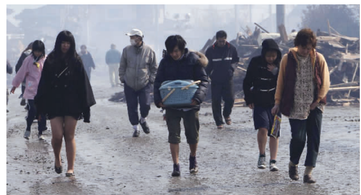
撤离 3月12日,在日本宫城县名取市,人们冒雨撤离已被摧毁的村庄