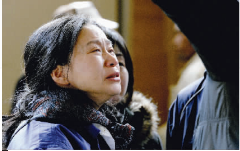
重逢 在日本岩手县一座被用作避难所的中学里,一名与朋友重逢的女子喜极而泣