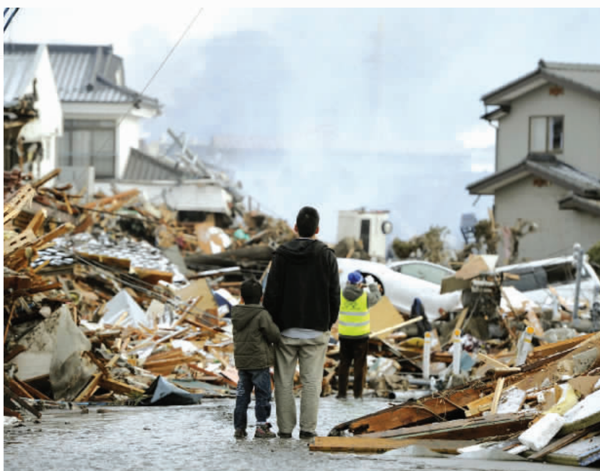
留恋 3月12日,在日本宫城县仙台市,一名男子带着孩子站在被地震毁坏的房屋前