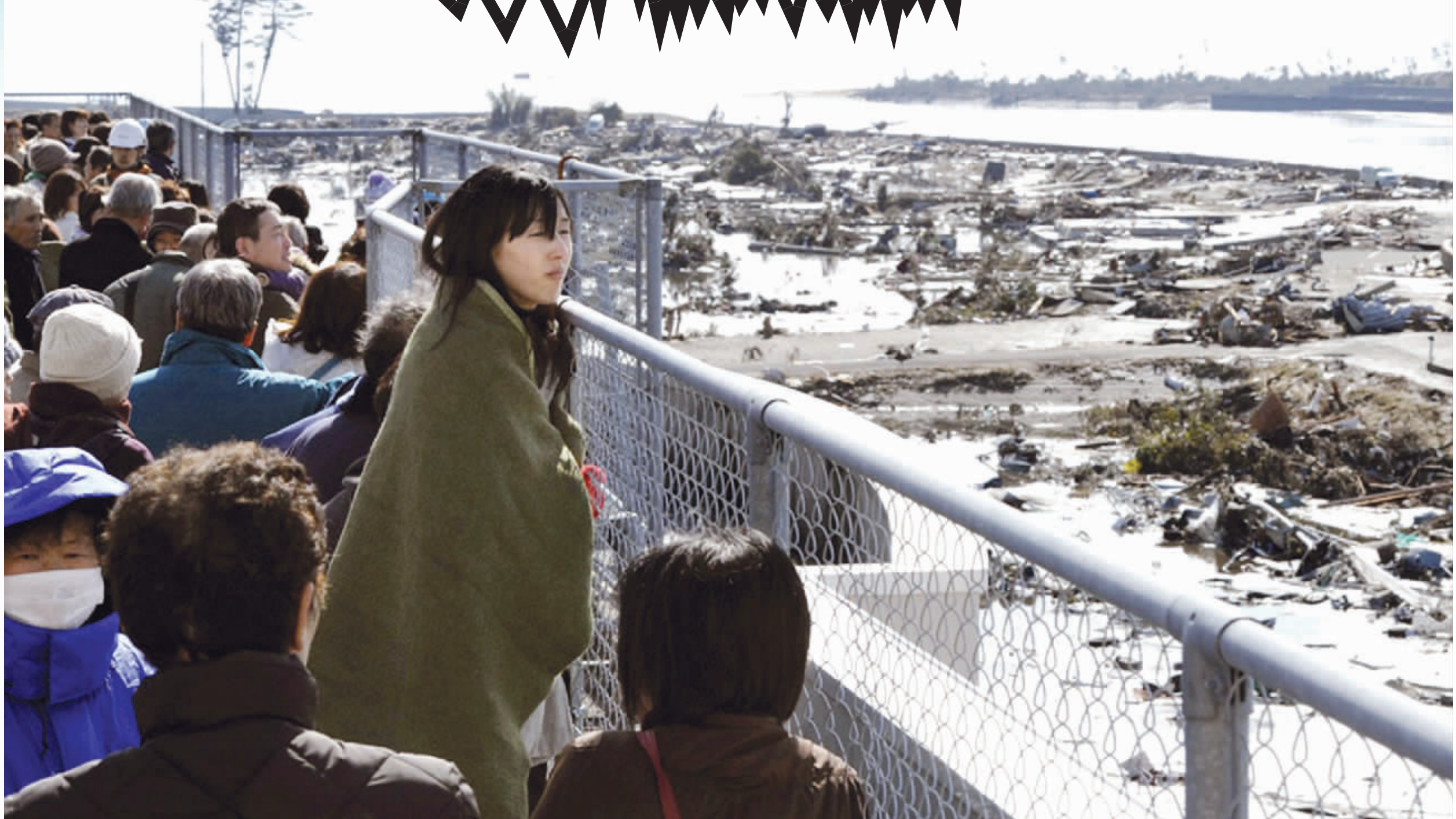
伤恸 3月12日,仙台,海啸过后,一名女子站在一处平台上张望远处的山体滑坡 凤凰网