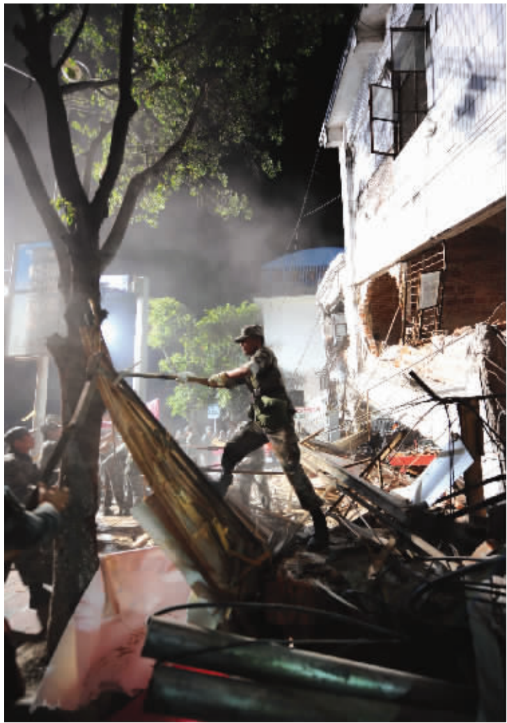
3月11日5时许,驻滇集团军某团官兵在灾区救援排危

据新华社北京3月11日电 3月10日12时58分,云南省德宏州盈江县发生里氏5.8级地震。党中央、国务院高度重视抗震救灾工作,胡锦涛总书记、温家宝总理立即作出重要批示,要求把抢救生命放在第一位,迅速开展抗灾救灾工作。习近平、李克强、周永康等领导同志也分别作出重要指示,对抗震救灾工作提出明确要求。