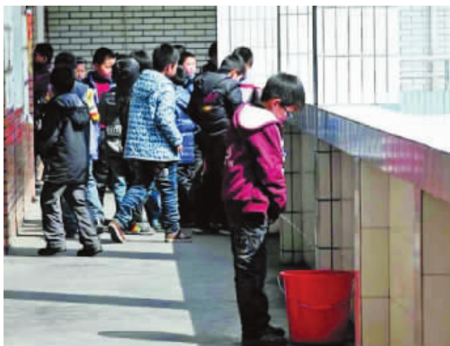
东阳一小学走廊上放着许多用来接童子尿的水桶,男孩们对此早有默契