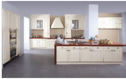
我乐橱柜推出的特价套餐