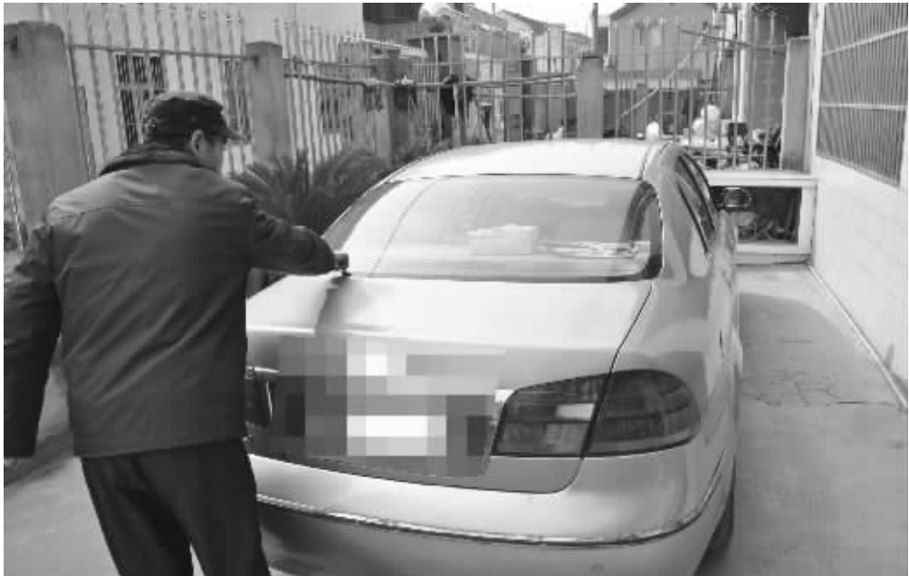
买辆新车带来的却是噩梦