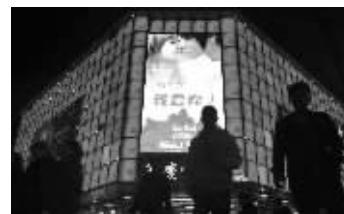
大屏幕上的道歉