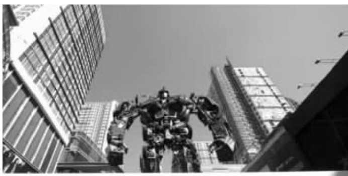
沈阳街头高大的变形金刚