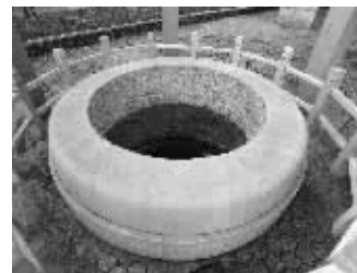
在南航校园内发现的太庙古井

另外，还有一些从明故宫流出去的构件和饰物，如今就驻留在南京城的各个角落里。南京市文物局文物处的丁波副处长告诉记者，比如，“马娘娘梳妆台”就位于白马公园里，“当时也是出于保护文物的需要，送到了白马公园。”