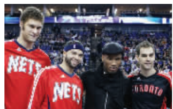
NBA在伦敦的比赛还吸引切尔西俱乐部球星德罗巴(左三)前来观赛

NBA曾多次在季前赛走进欧洲,但将常规赛放到欧洲的赛场,还是头一遭。昨天,NBA有史以来首次在欧洲进行常规赛,篮网在“主场”伦敦O2体育馆以116:103击败了猛龙。