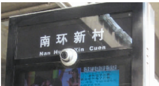
公交站“村”字注音让人一头雾水

“村”字的汉语拼音应该怎么标注?有网友在苏州某论坛上发帖称,他路过“南环新村”公交站时,发现站台上“村”字的拼音写成了“cuen”,虽然在电脑上输入“cuen”可以打出“村”字来,但如此标注是否可行呢?