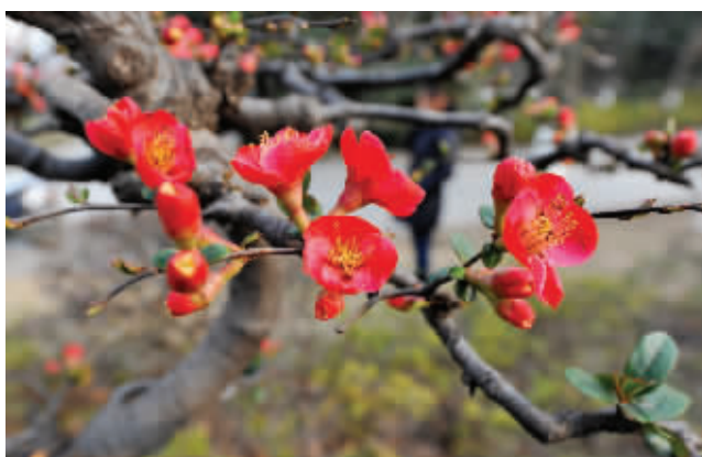
“一品香”的花形也绝对“一品”

快报讯(记者 毛丽萍)3月19日,莫愁湖公园第二十九届海棠花会将正式开幕,届时园内大概会有近20种海棠花盛开。值得一提的是,海棠花中唯一有香味的“一品香”今年由于照顾得当,已早于其它海棠花盛开。