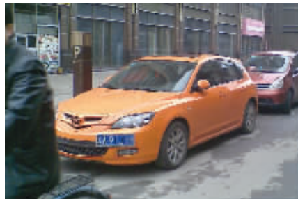
动了“歪心思”。2月27日摄于东妙峰庵 (作者张伟获30元话费,其余3张图均由陈文斌提供)