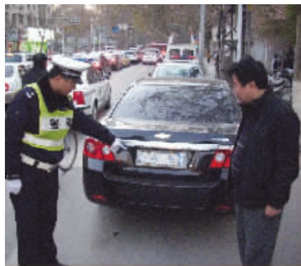
车子是蛮新的,牌照反光层却快掉光了