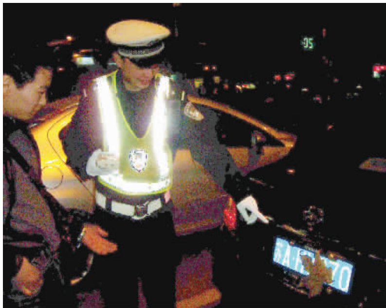
树叶挡车牌,车主说就是这么巧

牌照挂着一片树叶、反光层已经掉落、油漆遮住数字……南京机动交警大队近日接连发现这些投机取巧的遮牌方式,而车主们的回答几乎一致:巧合,无意的。