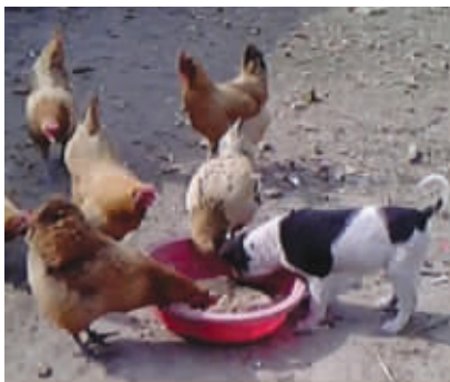
谁说鸡犬不宁,这不就是一幅和谐的鸡犬进食图吗? 2月10日摄于家门口 (作者方存永获30元话费)