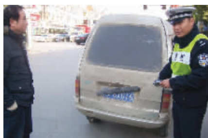
这个,一看就知道是有意的