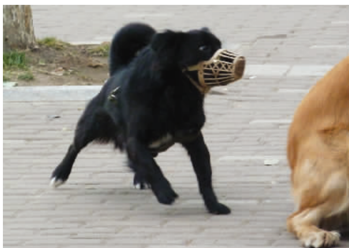
见到大狗,张不了牙就舞爪,这下知道为什么要给它上笼头了吧? 2月25日摄于新模范马路 (作者丽莉获30元话费)