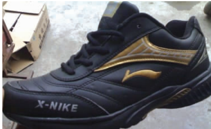
这才叫“一切皆有可能”