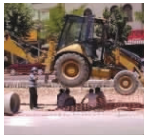
人民的创造力是无限的