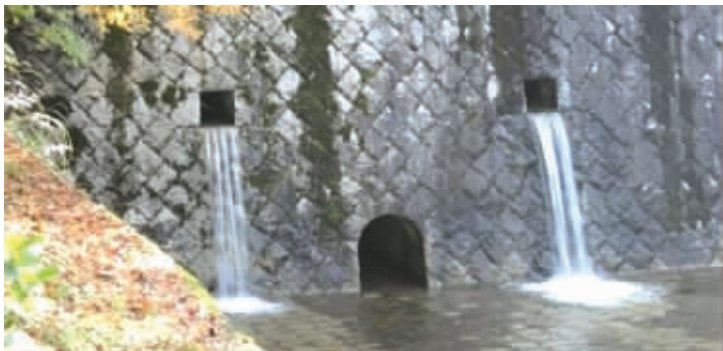
我的悲伤,流淌成河