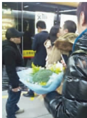
别把西兰花不当花!