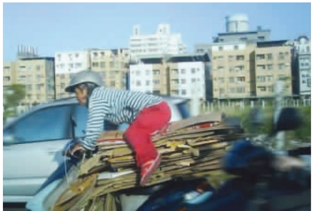
路上看到一位神奇的收旧老太