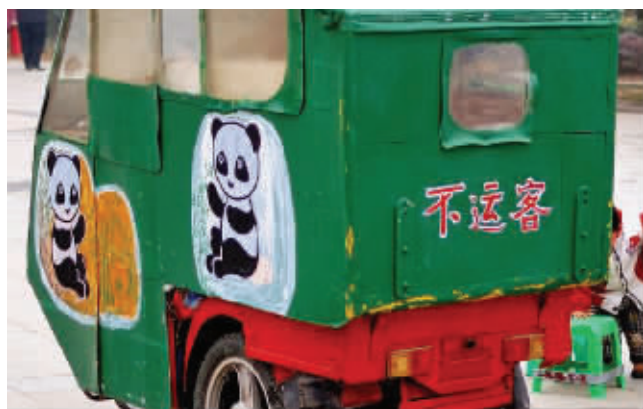
别再问我走不走,这是私家车