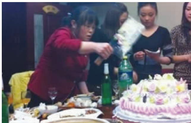
第一次见到蛋糕切得如此霸气