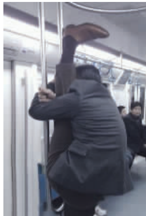
地铁太挤的时候,这招用得上