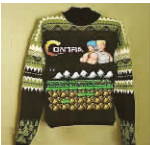
妈妈给我织了一件怀旧毛衣