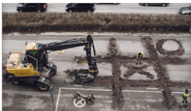
我就当你是寂寞了吧