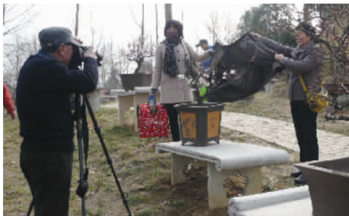
大家的功劳 好照片是这么来的。2月25日摄于梅花山