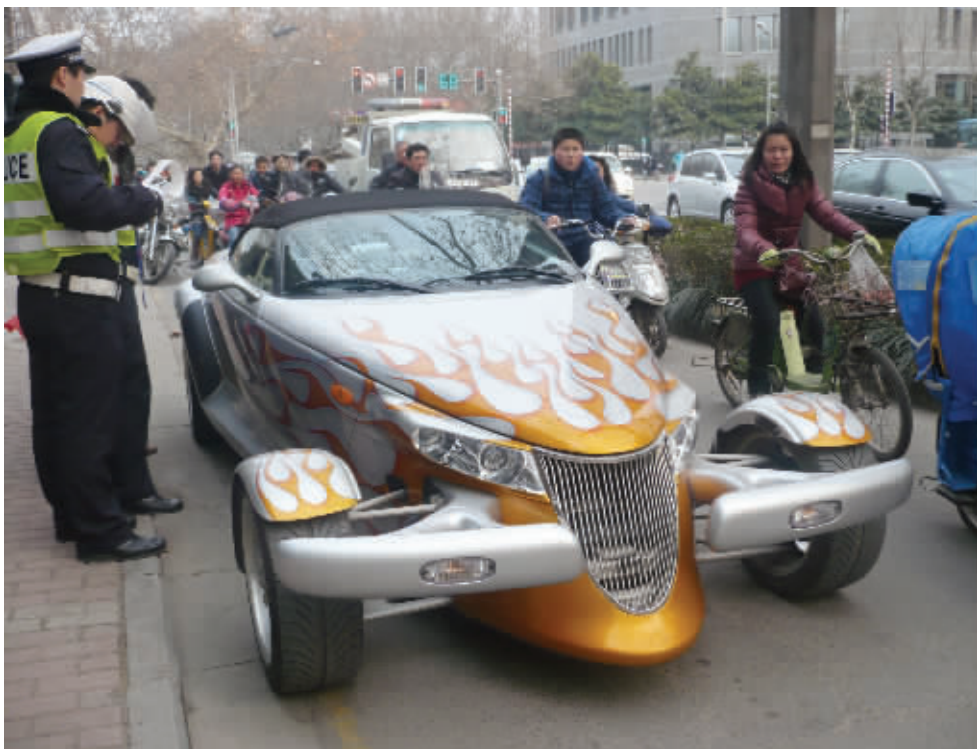
跑车上路很招眼,结果因为没有牌照把交警给“招”来了。2月25日下午摄于北京西路 (作者 郝炯获30元话费)