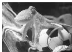
江湖只剩保罗的传说

预测多场世界杯比赛,方才一举成名;而负鼠姐早已因为其可爱的对眼成名,这次纯属客串,好比前者是躲起来练功的张无忌,一定要到光明顶的时候才能让大家佩服;而后者则像郭靖,早就在第二次华山论剑中崭露头角,所以后来丐帮屡屡搞什么英雄大会,郭大侠亮相,完全是来