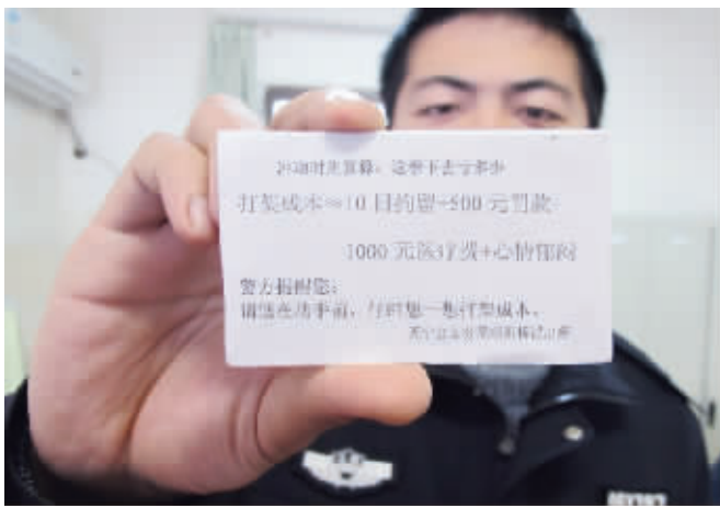
看看这张“打架成本卡”,你还会冲动挥拳吗?