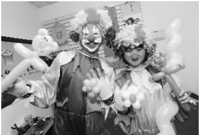
小美和春辉打扮成了小丑的样子

“哇,现在还专门有人演小丑!”前两天,在南京一家公司内部活动上登场的小丑给了员工们莫大的惊喜,他们原以为这是某位多才多艺的同事临时客串的,后来才得知是“外聘”来的专业人士。而这位演小丑的人原来也是个白领,为了给别人送快乐的梦想,她辞职创业了。