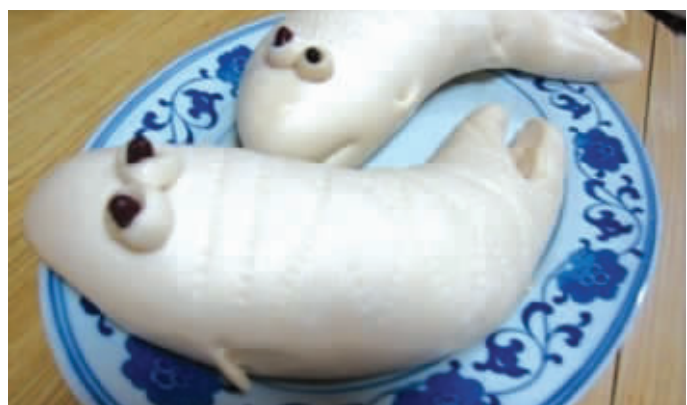
为什么我买的鱼形馒头这么傻？