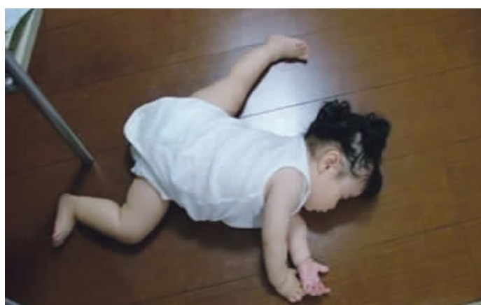
这孩子天生就是舞蹈家的料