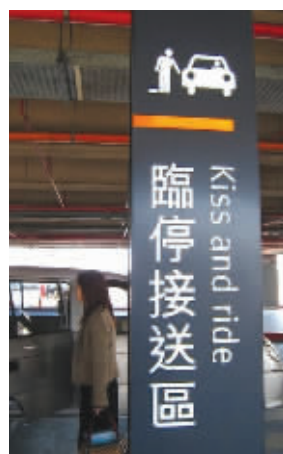
神一样的翻译，信达雅兼备