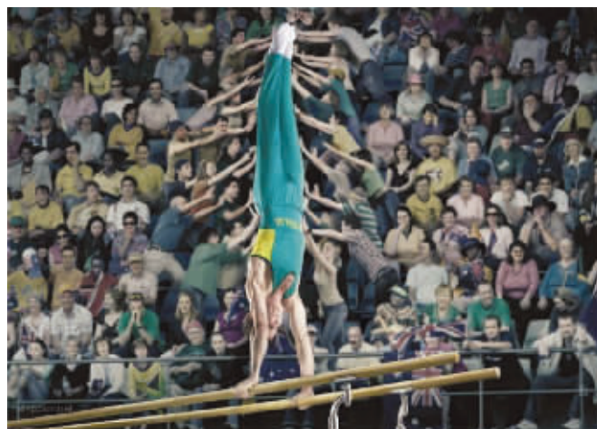
这些观众得有多寂寞啊