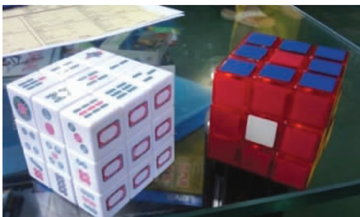
我猜还有三面是万、红中、发财