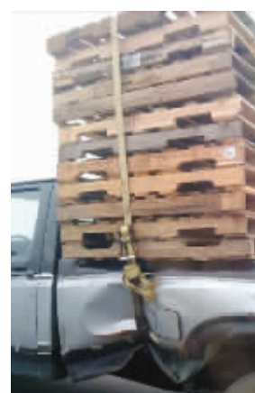
装车师傅的手劲真大