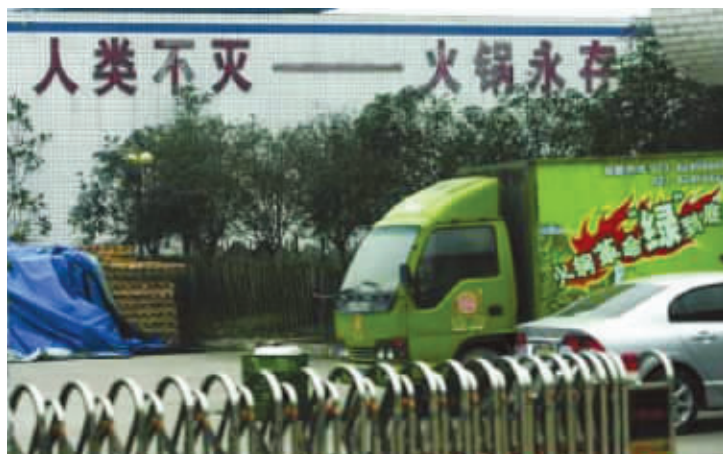
原来火锅才是人类最好的朋友