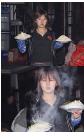
姑娘，你霸气外露了哦！