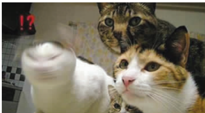
说过多少次了，拍照的时候不要晃