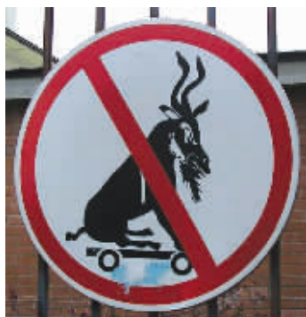
你倒是让它滑个滑板给我看看