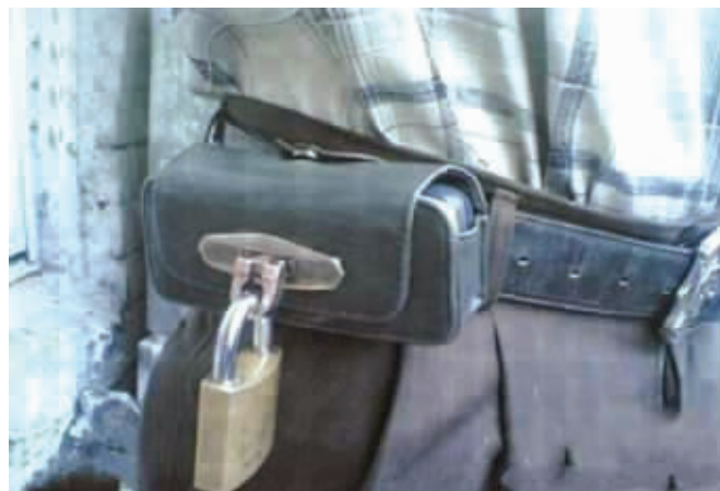
有了它，再也不怕手机被偷了！