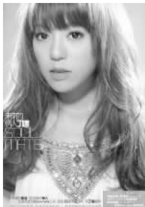
丁当《未来的情人》 厂牌:相信音乐 时间:1月21日

在新专辑里,丁当往日气势磅礴的作品少了,她现在唱的更多是偏向内心的歌,而“越是喃喃自语,感情越丰富,越难诠释”。但有一点可以肯定,丁当能把一个幼稚的梦唱成一段灿烂的交响乐章。当年在五月天小巨蛋演唱会上当嘉宾被嘘的阴影,想必已经在丁当心底吹散了。 邱大立