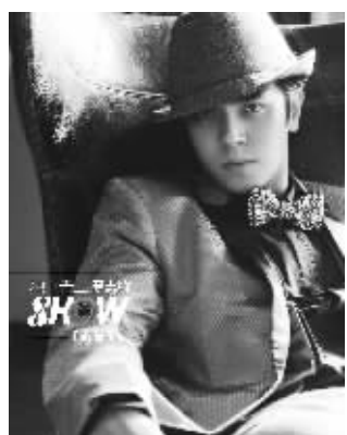
罗志祥《独一无二》 厂牌:金牌大风 时间:2月18日

呼应了罗志祥在娱乐圈中努力拼舞艺、拼人气、拼实力、拼梦想的形象。其次是,拼舞艺。罗志祥此番特别到美国洛杉矶邀请编舞家为歌曲《独一无二》编排全新舞蹈,特别设计了节奏流畅的翻手舞。再次是,拼造型。罗志祥每次出专辑总会带起一股时尚风潮,他在新专辑《独一无二》中更是将潮男形象再升级,演绎出兼具温文儒雅与款款深情的绅士风格,让大家知道即使穿得很绅士也能成为带领时尚的潮男。李蕾