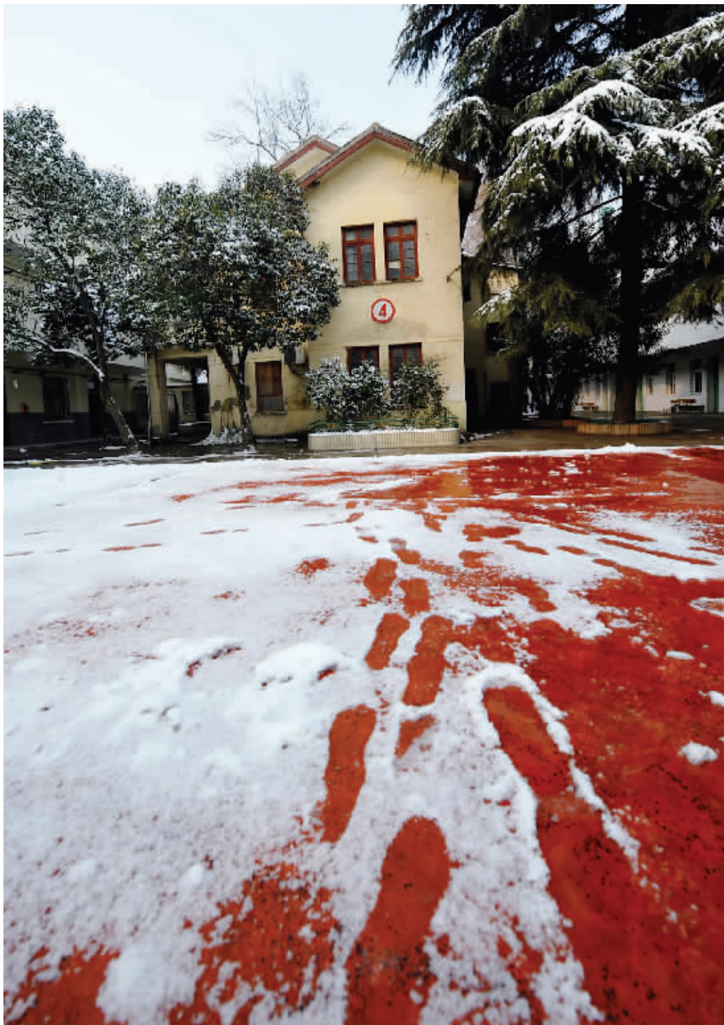
使馆旁边就是学校的篮球场