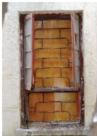
被家具遮挡住的窗户