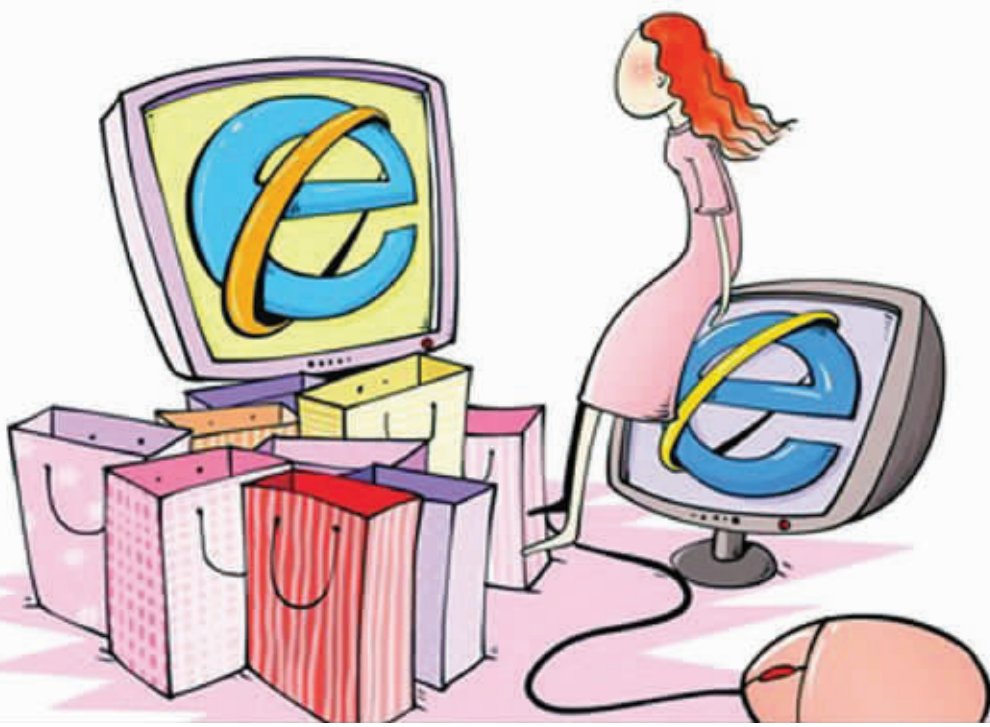
有了退运险,7天无理由退换货就更容易实现了 资料图片

记者购买了一件128元的商品,在确认时窗口弹出一条信息,告知如果购买“退货运费险”,只需花0.6元,因退货产生的运费即可由保险公司72小时内赔付12元。对于买家而言,若网购衣服、鞋帽等物品,经常由于质地、尺寸问题而退换货,运费通常由买家承担,少则10元,多则20多元。对于多花几毛钱买个保障,多数淘宝者表示并不介意。与此同时,有业内人士表示,这类险种的理赔也与常规不同,“不需要报案,也无需举证,交易结束后72小时内理赔款就可直接支付到买家的支付宝账户。”