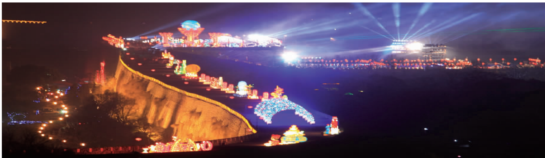
明城墙灯展美轮美奂