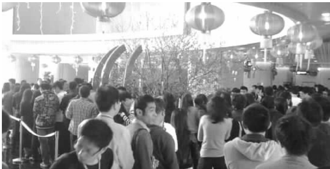
网友称腾讯公司领“开门利是”的场面如春运