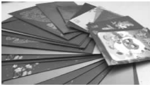
网友晒出的“开门利是”有多有少,甚至有厚厚一沓的毛票