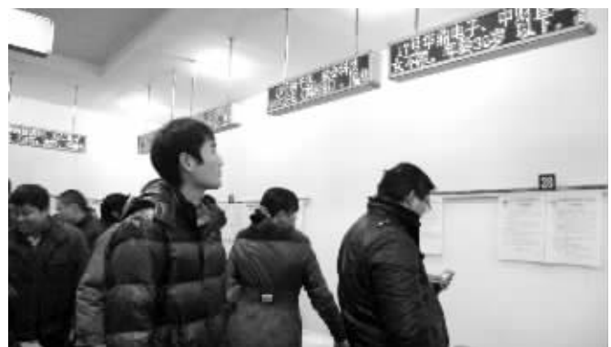
岗位增多,求职者选择的空间也越来越大