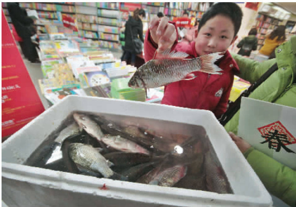
买书送鱼 昨天,新街口一家书城“创意”促销,只要你购买了一定金额的书籍,就赠送活鱼。过年送鱼,年年有余!

拿到锦旗,南京市城管局市政管理处高副处长表示很惊喜,她说,北安门街—明故宫路—御道街以及富贵山隧道出新改造工程,是去年10月中旬左右开工的,到去年12月底完成,全长5.6公里。该处的王科长表示,这次的出新之所以受到居民的称赞,他们总结主要是多征询了民意,而且都落到了实处。春节前后他们还要承担中山北路的新出改造工程,将继续遵照此做法,多征询民意。 快报记者 赵丹丹