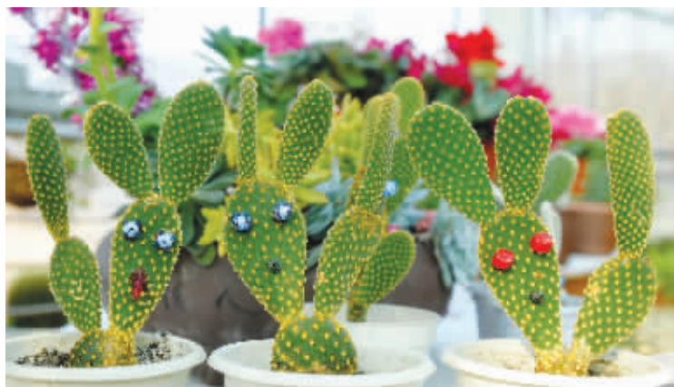
左图:兔耳仙人掌最有“兔子相”;右图:粉艳艳的兔耳花

中山植物园在每个新旧年交替之际,都会推出相关年份的植物展。兔年将至,植物园里有不少花草草,和可爱的小兔也“沾亲带故”。昨天,记者从中山植物园了解到,这里正在举办“兔植物展”,18种百余株“兔植物”集体亮相。眼下,正是观赏的最佳时期,展览将持续到2月20日。春节期间,有兴趣的市民也可以前往观赏。