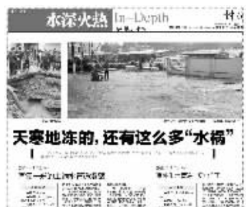
1月19日快报曾报道过和燕路的爆管事件