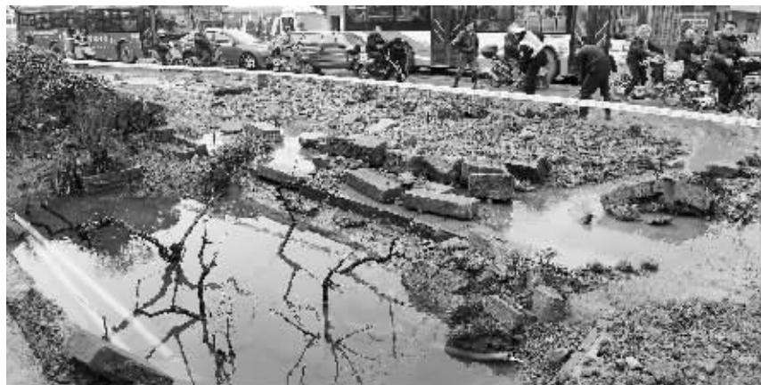
涌出的自来水将马路冲毁

昨天下午4点左右,和燕路一根地下主水管再次发生爆裂,路面鼓起,自来水卷着泥土喷涌而出,导致附近路段积水严重,交通受阻,几家店铺被淹。1月18日,也是这根水管发生爆裂,两次爆裂位置仅隔20米左右。事故导致千余户居民家停水。