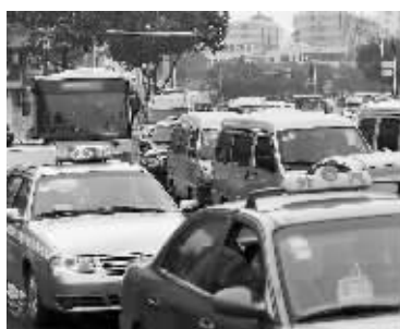
爆管导致交通受阻