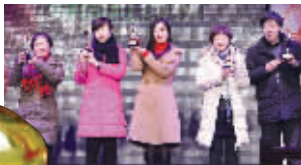
左起唯真、伊贝丝、泰秘丽人、美丽妈妈、百年丽人的代表荣获“小金人”奖杯