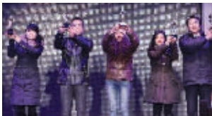
左起紫颖、瘦狐体雕、真水无香、克丽缇娜、奇致的代表荣获“小金人”奖杯