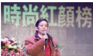
中国美容美发协会会长、江苏美容美发协会会长王建发表行业总结