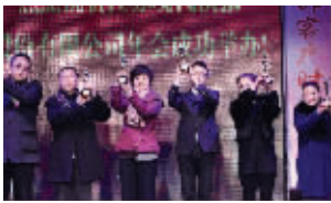
左起美的世界、宝丽来、王春美容院、高丽人、洛丽塔、超妍美容的代表荣获“小金人”奖杯