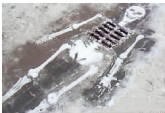
早上出门看到个雪人,吓死我了