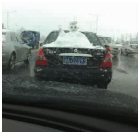
注意,雪天保持车距,耶!