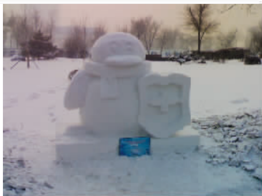
冰雪见证我们纯洁的友谊