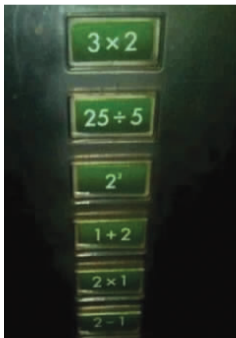
某大学数学系的电梯