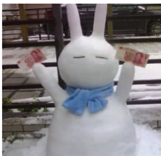
兔年发钞票,一给就是two