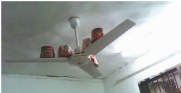
自从老鼠横行,哥就会了轻功