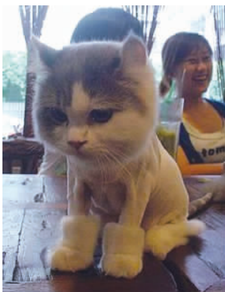
主人说给我买雪地靴,她骗我!