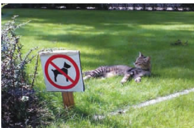
找个没有狗的地方,享受生活