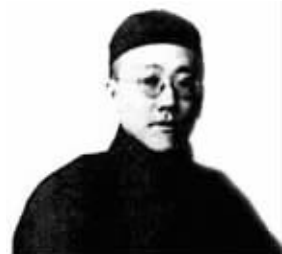
作为长子,袁克定妄想亲承帝后,自己能够继承大统

这位工作人员还告诉记者,叶蓁死后不久,大概是1959年6月左右,南京市人民政府发来了一份公函,说经查叶蓁在南京的房屋有半条街之多,那在1937年前是叶蓁私产。日本占领南京后,被日军机关占用了。抗战胜利后,由国民党军队按敌伪遗产接收,没查出房子主人是谁,就用作军营。上世纪50年代南京政府落实私产政策,查证房屋的主人是叶蓁。经与北京联系得知叶蓁移居宁夏,便发函通知叶蓁接收。但由于叶蓁已死,当时通信困难,此事也就不了了之。“很多人传言袁世凯的六姨太是南京钓鱼巷的妓女,从这件事来看,那绝对就是谣言。至于她的真实身份是什么,现在已经无法核实的。”那位工作人员说。