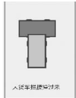
大货车拦腰撞过来