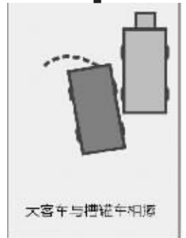
大客车与槽罐车相撞