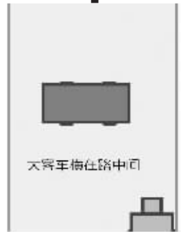
大客车横在路中间