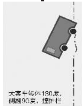
大客车转体180度, 侧翻90度, 撞护栏