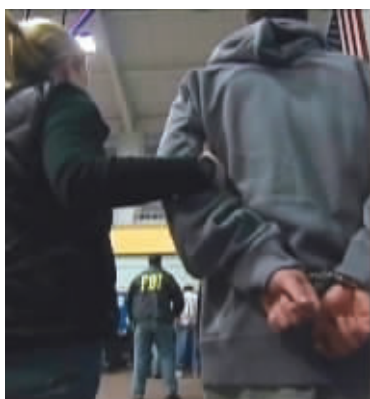
1月20日,在美国纽约,联邦调查局探员逮捕黑手党成员(电视截图)

美国执法部门当地时间1月20日抓捕了127名参与有组织犯罪的黑手党嫌疑人,其中包括纽约五大黑手党家族的重要成员,美国司法部长埃里克·霍尔德称此举是纽约历史上最大规模的打黑行动。