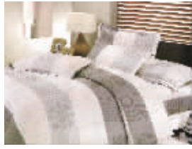
印花四件套,促销价199元/套