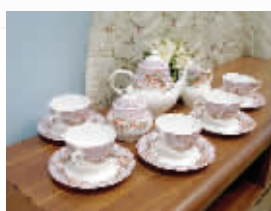
玫瑰花园咖啡具,促销价199元