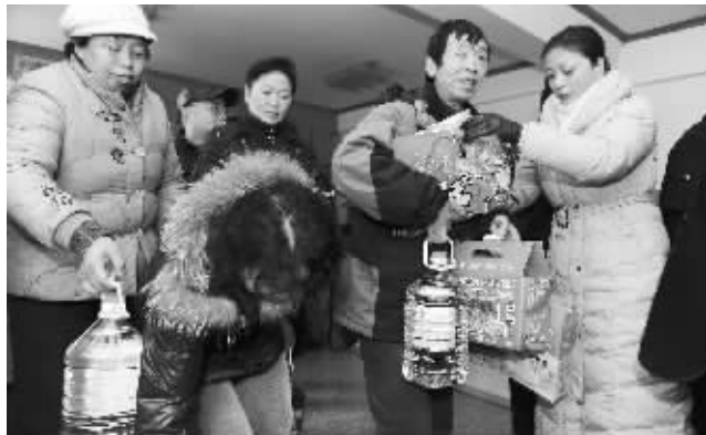
有了这些年货,能过个好年了