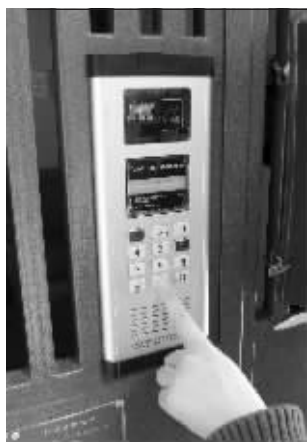
智能防盗门系统

据悉,中国红基金会幸福天使基金“以爱育爱,幸福天使行动”江苏省救助计划1月21日将在南京正式启动。