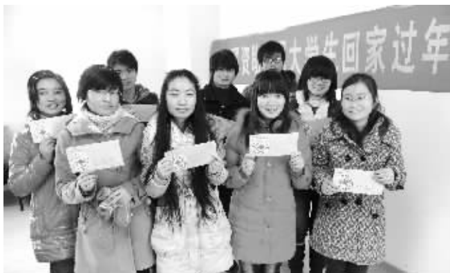
昨天,南财大的一些贫困生拿到了回家过年的路费