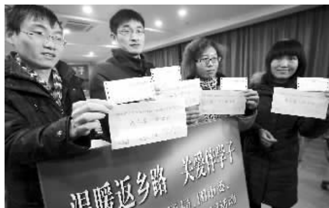
收到南京市交通运输局送来的回家车票和路费,南京大学的学子们很感动

南京市交通运输局副巡视员徐卫国表示,“1000”只是一个底数,如果有特殊的群体,那就特殊对待。