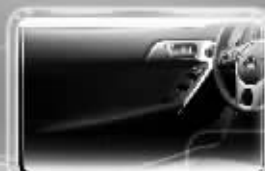
皮包裹门护板扶手