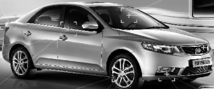
时尚虎口增加高光黑边框