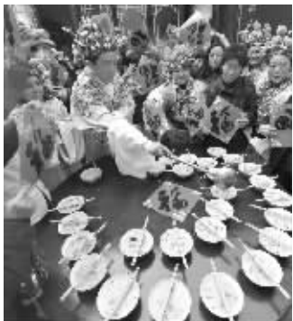
“朱元璋”“马娘娘”发粥送福

昨天一大早,记者在玄奘寺看到,赶来喝腊八粥的市民排起了长队,热腾腾的粥看起来香甜诱人。而送粥的人也很特别,居然是一身龙袍的“朱元璋”和头戴凤冠的“马娘娘”。因为关于腊八粥的起源,有一个说法就与朱元璋有关。据说当年朱元璋落难在监牢里受苦时,正值寒冬,又冷又饿的朱元璋竟然从监牢的老鼠洞里刨找出一些红豆、大米、红枣等七八种五谷杂粮。于是他把这些东西熬成了粥,而当天正是腊月初八,朱元璋便将这锅杂粮粥美名其曰腊八粥,美美享受了一顿。后来他平定天下做了皇帝,就将这一天定为腊八节,把自己那天吃的杂粮粥正式命名为腊八粥。“朱皇帝”亲自派送粥,市民也觉得格外热闹有趣,很有过节的氛围。