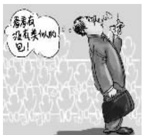
③物品千万别离开自己的视线