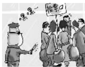
④人多拥挤时小心随身的财物