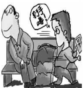
②出门前收拾物品要有技巧