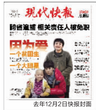
去年12月2日快报封面