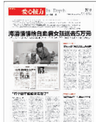
去年12月2日快报封8版