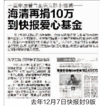
去年12月7日快报封9版