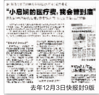
去年12月3日快报封9版