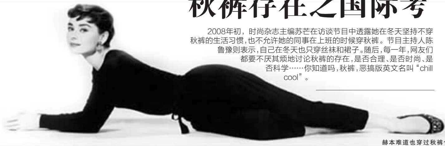
赫本难道也穿过秋裤?