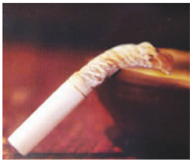
香烟表面上带给男人阳刚之气,实则是造成男人阳痿的主要原因