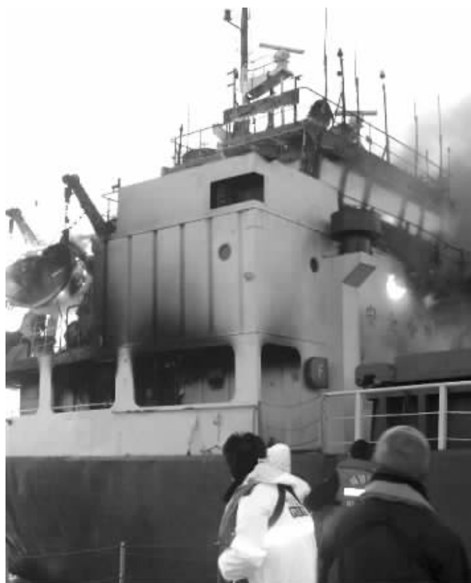
1月7日,在韩国釜山港外,消防队员试图给起火的货轮灭火

米的价格水平,同比上涨约6%。对比2010年和2009年住宅用地成交面积和成交均价可以看出,量价齐涨是2010年土地出让金大幅上涨的主要原因,2010年全国120个城市住宅用地成交量同比上涨30%,但成交楼面均价同比上涨6%,可见成交量增加是土地出让金增加的主因。记者发现,北京和上海2010年的住宅用地成交均价分别比2009年上涨了29%和17%。综合