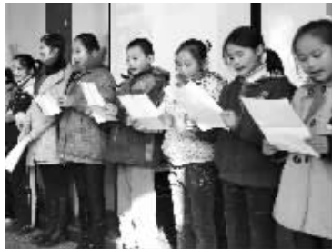
孩子们在现场朗诵小诗《心里话》

新东方教育科技集团作为中国著名私立教育机构及爱心慈善企业, 一直致力于回馈和服务社会。南京新东方秉承集团教育理念在南京玄武红山外来工子弟小学开展活动, 老师们不仅乐于以最专业的水准给学